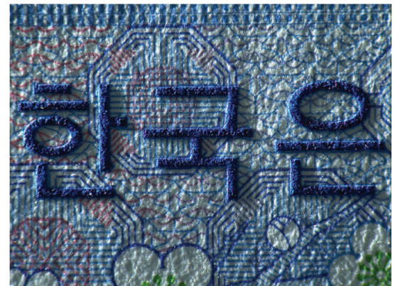
VSC: Präzise Bildgebungstechnologie